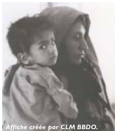
Affiche créée par CLM BBDO.

L'agence CLM BBDO a créé gracieusement une affiche pour l'hôpital de Kaboul. Les afficheurs Métrobus et Clear Channel ont offert des nombreux panneaux d'affichage sur leurs réseaux respectifs.