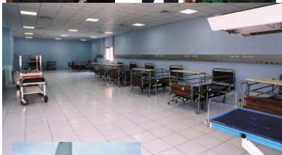
Intérieur de l'hôpital.