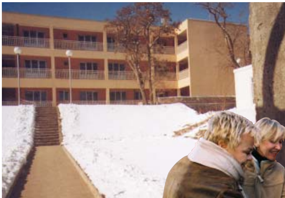
La construction de la phase 1 est achevée.