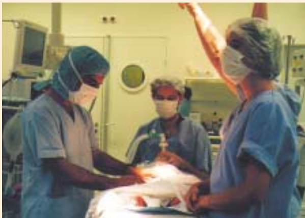
Médecins afghans en formation en France.