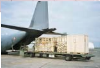
Livraison du matériel.